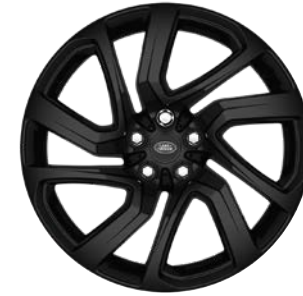
21" S 5 ZDVOJENÝMI LÚČMI, VZOR 5025, LESKLÉ ČIERNE Štandardná výbava pre Dynamic SE