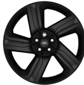
22" S 5 ZDVOJENÝMI LÚČMI, VZOR 5124, LESKLÉ ČIERNE Štandardná výbava pre Dynamic HSE a Commercial Dynamic HSE