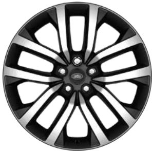
21" S 5 ZDVOJENÝMI LÚČMI, VZOR 5123 2 , LESKLÉ TMAVOSIVÉ S KONTRASTNÝMI PLOCHAMI OPRACOVANÝMI DIAMANTOVÝM SÚSTRUŽENÍM