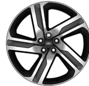
22" S 5 ZDVOJENÝMI LÚČMI, VZOR 5124 2 , LESKLÉ TMAVOSIVÉ S KONTRASTNÝMI PLOCHAMI OPRACOVANÝMI DIAMANTOVÝM SÚSTRUŽENÍM Sériová výbava pre 35 th Anniversary Edition