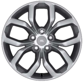
19" S 5 ZDVOJENÝMI LÚČMI, VZOR 5021 1 , LESKLÉ STRIEBORNÉ