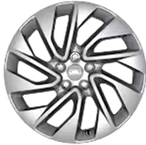
20" S 5 ZDVOJENÝMI LÚČMI, VZOR 5122 1 , LESKLÉ STRIEBORNÉ Štandardná výbava pre Dynamic S