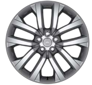
21" S 5 ZDVOJENÝMI LÚČMI, VZOR 5123 3 , LESKLÉ STRIEBORNÉ Štandardná výbava pre Commercial SE