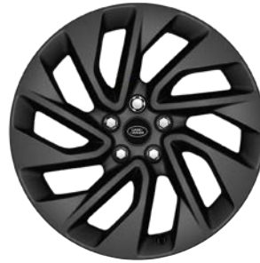
20" S 5 ZDVOJENÝMI LÚČMI, VZOR 5122 2 , MATNÉ TMAVOSIVÉ