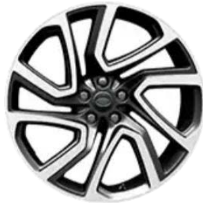
22" S 5 ZDVOJENÝMI LÚČMI, VZOR 5025, MATNÉ TMAVOSIVÉ S KONTRASTNÝMI PLOCHAMI OPRACOVANÝMI DIAMANTOVÝM SÚSTRUŽENÍM