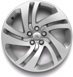
18" S 5 ZDVOJENÝMI LÚČMI, VZOR 5074, STRIEBORNÉ Štandardná výbava pre S