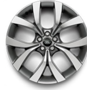
20" S 5 ZDVOJENÝMI LÚČMI, VZOR 5076 1 , LESKLÉ STRIEBORNÉ (MID-SILVER) S KONTRASTNÝMI PLOCHAMI OPRACOVANÝMI DIAMANTOVÝM SÚSTRUŽENÍM Štandardná výbava pre Dynamic HSE