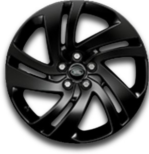
18" S 5 ZDVOJENÝMI LÚČMI, VZOR 5074, LESKLÉ ČIERNE