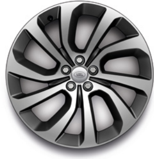
20" S 5 ZDVOJENÝMI LÚČMI, VZOR 5089, LESKLÉ TMAVOSIVÉ S KONTRASTNÝMI PLOCHAMI OPRACOVANÝMI DIAMANTOVÝM SÚSTRUŽENÍM