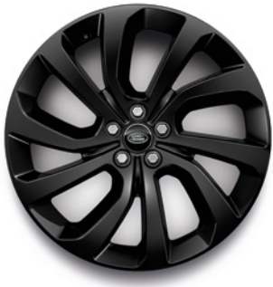
20" S 5 ZDVOJENÝMI LÚČMI, VZOR 5089, LESKLÉ ČIERNE