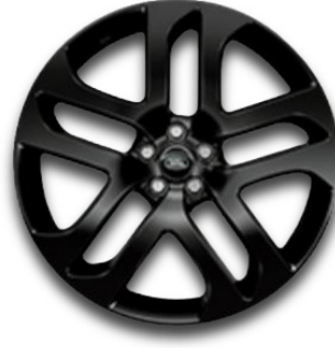
21" S 5 ZDVOJENÝMI LÚČMI, VZOR 5078 2 , LESKLÉ ČIERNE