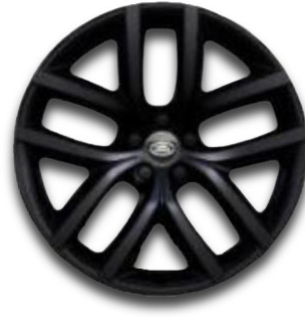
19" S 5 ZDVOJENÝMI LÚČMI, VZOR 5136, LESKLÉ ČIERNE