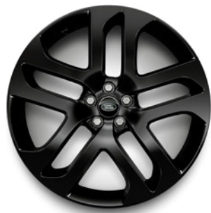
21" S 5 ZDVOJENÝMI LÚČMI, VZOR 5078 5 , LESKLÉ ČIERNE