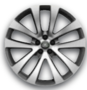
21" S 5 ZDVOJENÝMI LÚČMI, VZOR 5137 5 , LESKLÉ TMAVOSIVÉ S KONTRASTNÝMI PLOCHAMI OPRACOVANÝMI DIAMANTOVÝM SÚSTRUŽENÍM Štandardná výbava pre Autobiography D200 AWD