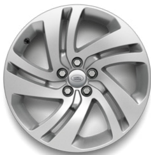
18" S 5 ZDVOJENÝMI LÚČMI, VZOR 5074 1 , STRIEBORNÉ Štandardná výbava pre S