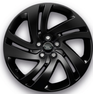
18" S 5 DVOJITÝMI LÚČMI (VZOR 5074) 1 , LESKLÉ ČIERNE