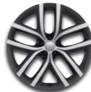
19" S 5 ZDVOJENÝMI LÚČMI, VZOR 5136 3,4 , LESKLÉ TMAVOSIVÉ S KONTRASTNÝMI PLOCHAMI OPRACOVANÝMI DIAMANTOVÝM SÚSTRUŽENÍM Štandardná výbava pre Dynamic SE D165 AWD a Dynamic SE D200 AWD