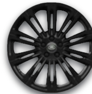
20" S 10 LÚČMI, VZOR 1085, LEKSLÉ ČIERNE