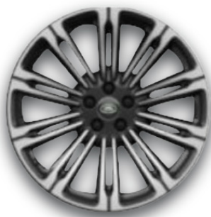
20" S 10 LÚČMI, VZOR 1085, LESKLÉ TMAVOSIVÉ S KONTRASTNÝMI PLOCHAMI OPRACOVANÝMI DIAMANTOVÝM SÚSTRUŽENÍM Štandardná výbava pre Dynamic HSE, Dynamic SE P270e AWD a Autobiography P270e AWD