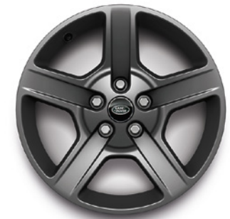
20", VZOR 5094 2.4 , MATNÉ TMAVOSIVÉ Štandardná výbava pre X-Dynamic SE a Hard Top X-Dynamic SE