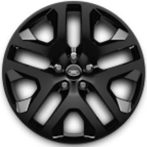
20", VZOR 5095 2,3 , LESKLÉ ČIERNE Štandardná výbava pre Outbound