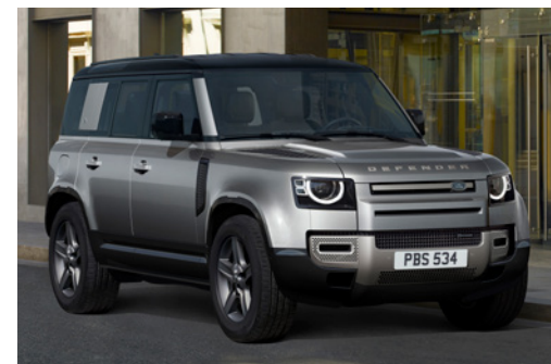
DEFENDER 110 X-DYNAMIC SE