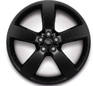
22", VZOR 5098 2,7,13,14,15 , LESKLÉ ČIERNE Štandardná výbava pre Sedona Edition