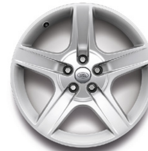
20", VZOR 5094 2.4 , LESKLÉ STRIEBORNÉ