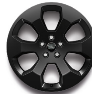
20", VZOR 6011 2.7.8 , LESKLÉ ČIERNE