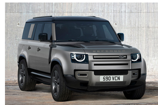
DEFENDER 130 X-DYNAMIC HSE