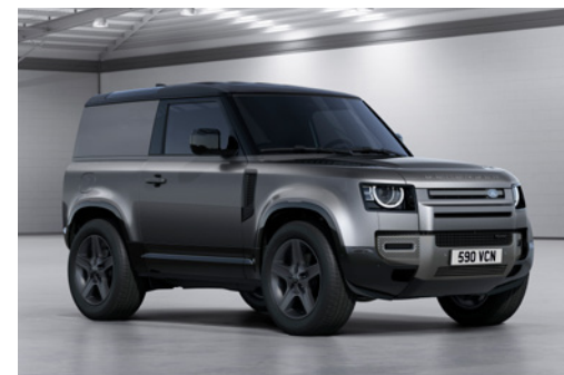
DEFENDER 90 HARD TOP X-DYNAMIC SE