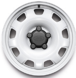
18", VZOR 50931 1 , LESKLÉ BIELE OCELOVÉ