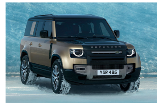
DEFENDER 130 X