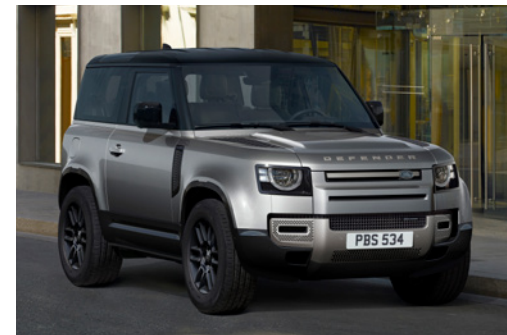
DEFENDER 90 X-DYNAMIC SE