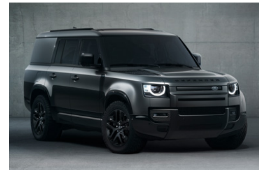
DEFENDER 130 OUTBOUND

Upozorňujeme, že štandardná výbava môže byť nahradená doplnkovou výbavou.