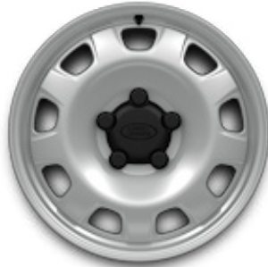
20", VZOR 9013 2,10 , LESKLÉ BIELE