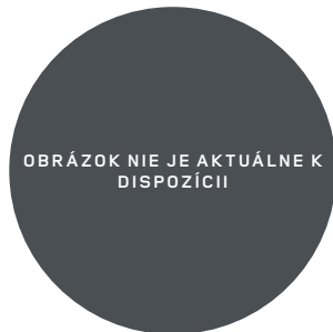
22", VZOR 7026 2,7,11 , LESKLÉ ČIERNE Štandardná výbava pre OCTA