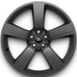
22", VZOR 5098 2,7,13,14,16 , MATNÉ TMAVOSIVÉ Štandardná výbava pre V8