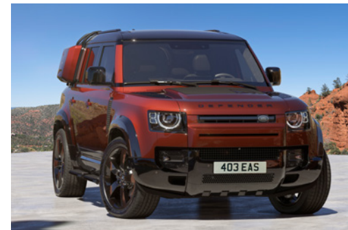
DEFENDER 110 SEDONA EDITION

Zobrazené vozidlo je len ilustračné a môže obsahovať doplnkovú výbavu. Ďalšie informácie k doplnkovej výbave a jej dostupnosti vám poskytne váš partner Land Rover.