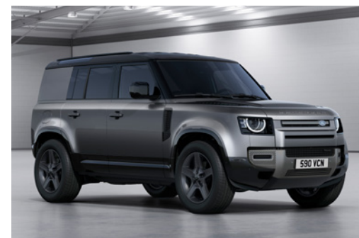
DEFENDER 110 HARD TOP X-DYNAMIC SE