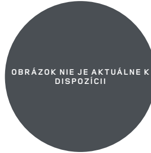
20", VZOR 1086 2,11,12 , OPRACOVANÉ DIAMANTOVÝM SÚSTRUŽENÍM, MATNÉ TMAVÉ S KONTRASTNÝMI PLOCHAMI V MATNEJ ČIERNEJ FARBE Štandardná výbava pre OCTA Edition One.