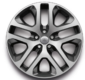
20", VZOR 5095 2.4 , LESKLÉ TMAVOSIVÉ S KONTRASTNÝMI PLOCHAMI OPRACOVANÝMI DIAMANTOVÝM SÚSTRUŽENÍM