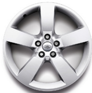
20", VZOR 5098 2.4.5 , LEŠTENÉ STRIEBORNÉ