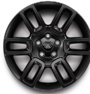
19", VZOR 6010 2.3 , LESKLÉ ČIERNE