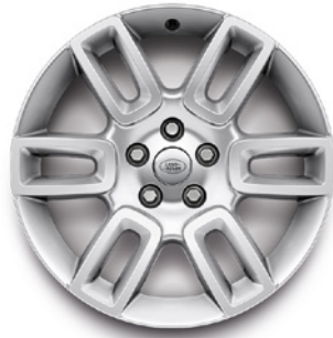
19", VZOR 6010 2.3 , LESKLÉ STRIEBORNÉ Štandardná výbava pre S a Hard Top S