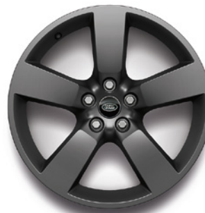
20", VZOR 5098 2.5.6 , MATNÉ TMAVOSIVÉ Štandardná výbava pre HSE