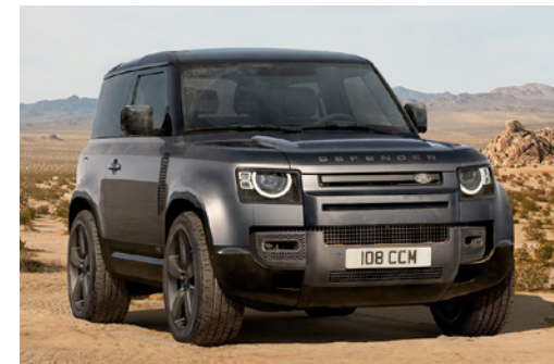
DEFENDER 90 V8