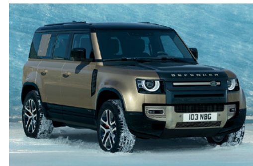
DEFENDER 110 X