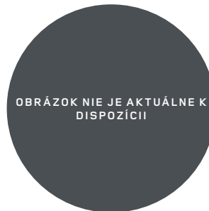
22", VZOR 7026 2,7,11 , S ČIERNYMI LESKLYMI KONTRASTNÝMI PLOCHAMI OPRACOVANÝMI DIAMANTOVÝM SÚSTRUŽENÍM