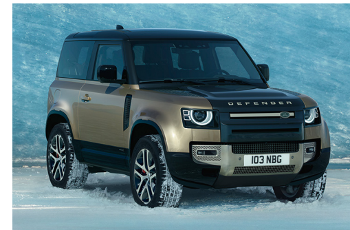
DEFENDER 90 X