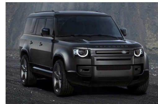
DEFENDER 130 V8