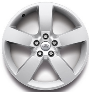
20", VZOR 5098 2.4 , LESKLÉ STRIEBORNÉ