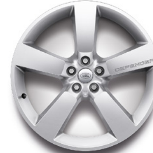
22", VZOR 5098 2,7,13,14 , LESKLÉ STRIEBORNÉ Štandardná výbava pre X